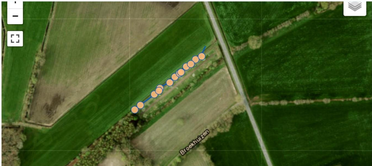
Figuur 3 Voorbeeld van een gelopen route/transect, zichtbaar via het waarneming.nl account. De stippen zijn waargenomen vlinders