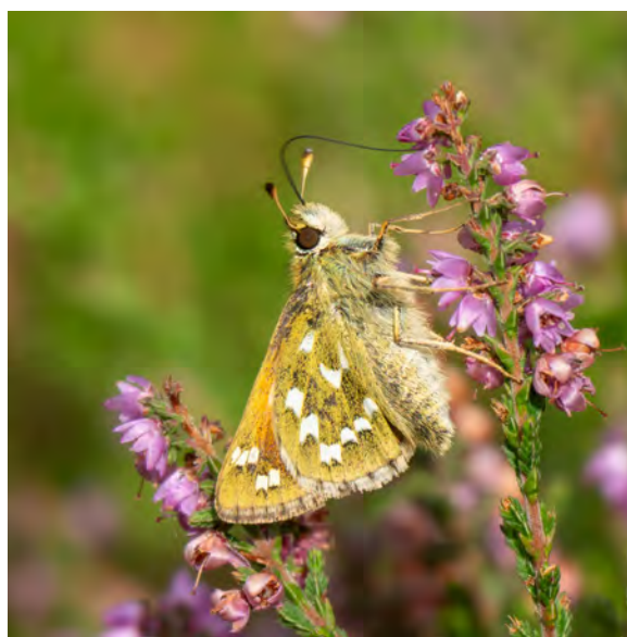
Kommavlinder op Struikhei. Elper-Westerveld, augustus 2023.

hele toer. Elke keer als ik de vlinder benader vliegt hij of zij weg en probeer ik de vlinder te volgen. Dan moet je geluk hebben dat je gezien hebt waar de vlinder is gaan zitten. Ervaring leert echter dat als je de vlinder voorzichtig benadert er uiteindelijk wel een foto in zit. Op deze manier heb ik toch vijf vlinders kunnen fotograferen. Op de terugweg naar de auto neem ik nog even een korte pauze en even later zit ik lekker op de heide te genieten van een broodje. Tijdens dit soort momenten zie je vaak ook van alles vliegen en kan ik inderdaad nog een zesde Kommavlinder noteren.