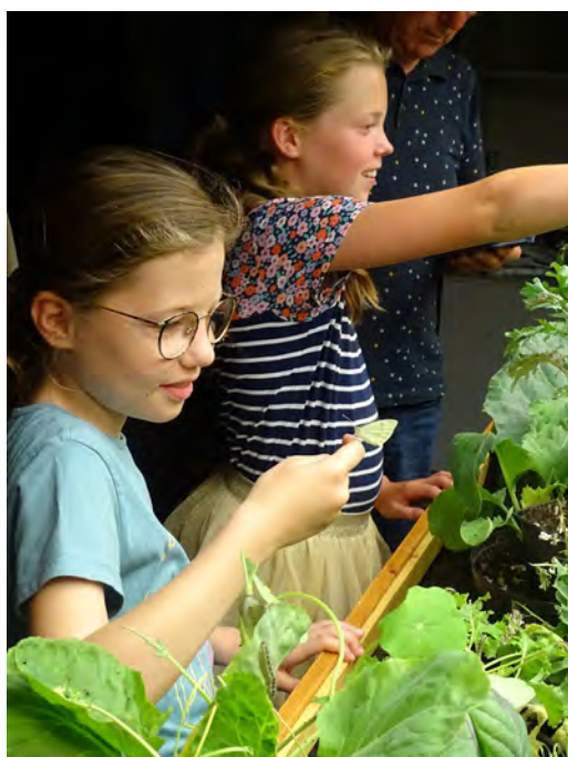
Zo'n ervaring vergeet je nooit!