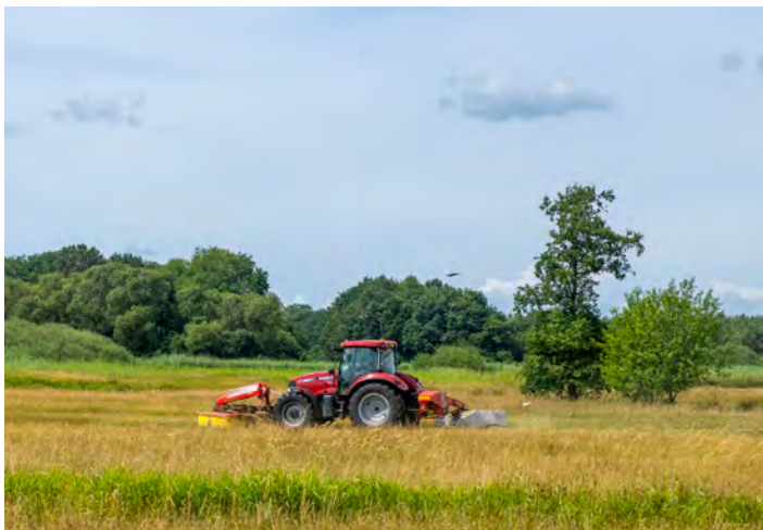
Maaien percelen Reestdal, zomer 2023.