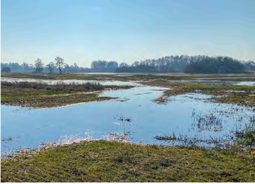
Hoog water in het Reestdal, februari 2023