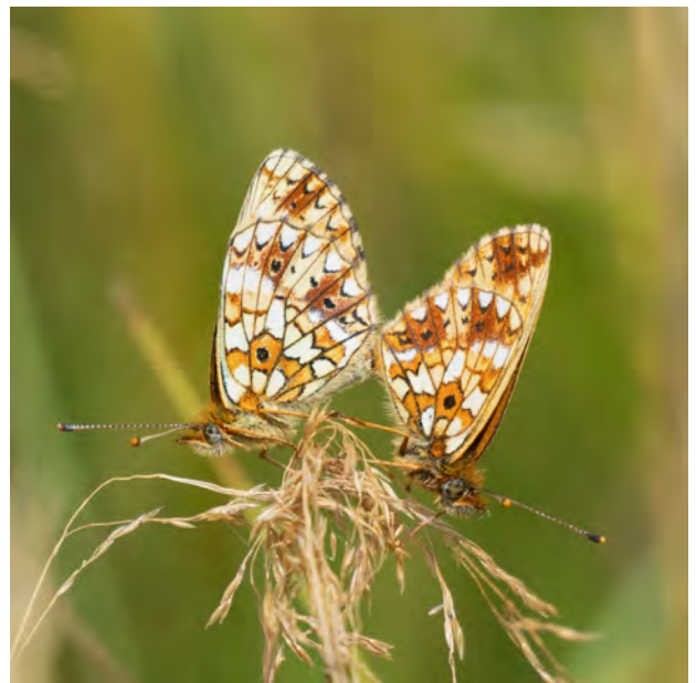
Parende Zilveren manen in het Reestdal, 18 juli 2023.