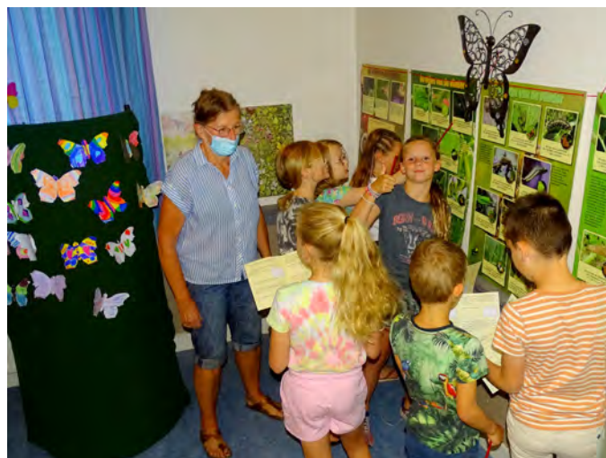
Fanatiek meedoen aan het vlinderspel.

De andere helft ging naar de donkere kamer en wisselde na een half uur met de eerste. Het werd in de sluis al stil en in de donkere kamer konden de kinderen vrij en zonder barrière naar de vlinders kijken. Een vlinder aanraken, zien hoe ze paarden, eitjes legden, rupsen zien die vraten en groeiden en verpopten en poppen zien, die uitkwamen. Er vlogen vooral Groot koolwitjes rond maar ook enkele andere soorten zoals blauwtjes en Hooibeestjes. Het plan om ook de cyclus van Dagpauwogen te laten zien is niet gelukt omdat er domweg veel te weinig Dagpauwogen waren en in die tijd ook geen enkele rups. Bijzonder was dat al de eerste dag de kinderen konden zien hoe twee Koninginnenpages uit de pop kwamen. Die poppen had een van onze leden zorgvuldig laten overwinteren. Er vlogen dus de hele week ook twee Koninginnenpages rond.