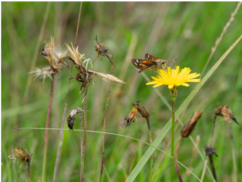
Kommavlinder op Gewoon biggenkruid. Elper-Westerveld, augustus 2023.