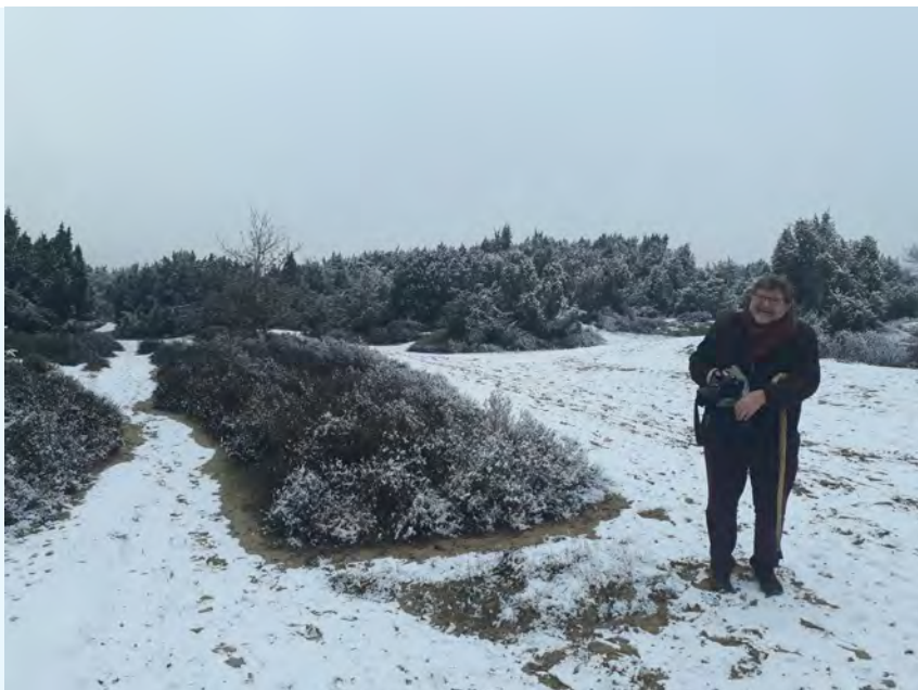
Op het Mantingerzand, januari 2019.