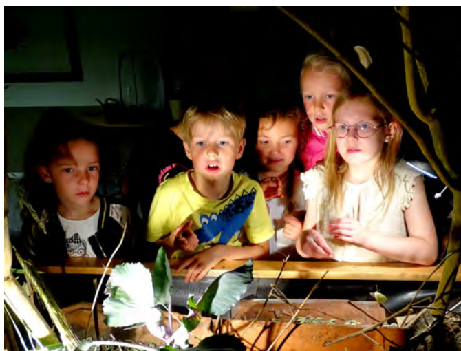
Vol aandacht bij de poppentafel.

Het was fantastisch om te zien hoe stil de kinderen waren. Hoe ook de grote jongens enthousiast werden wanneer ze een vlinder op hun hand konden houden en hoe graag ze er nog langer wilden blijven. De scholen hebben naderhand enthousiast en dankbaar gereageerd. Ons belangrijkste doel: 'Kinderen in direct contact brengen met het vlinderleven' is met deze vlinderweek volledig geslaagd. Zo'n 50 vrijwilligers hebben meegedaan aan de voorbereiding en de uitvoering van deze week en ik ben dankbaar dat het allemaal gelukt is.