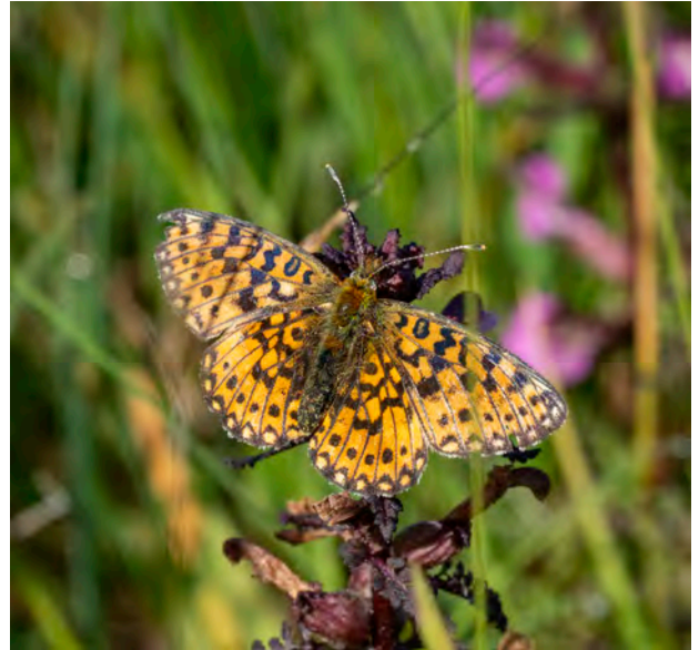
Zilveren maan op Moeraskartelblad.

Ondanks het wankel evenwicht weet de Zilveren maan zich in het Reestdal toch alweer een kleine tien jaar te handhaven, maar de populatie is ook anno 2023 klein en kwetsbaar.