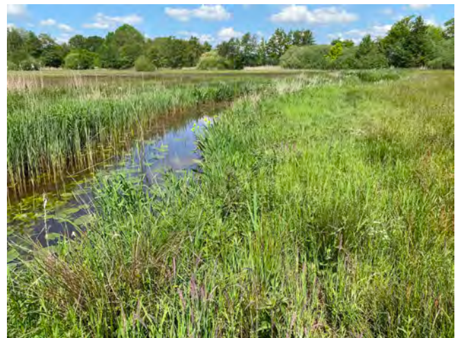
Verruigte oever langs de Reest.