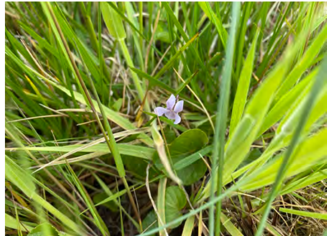
Moerasviooltje, de waardplant van de Zilveren maan.

Enkele jaren geleden is het project 'water-op-maat' in het Reestdal uitgevoerd. Door aanleggen van drempels in de Reest en het dempen van greppels zijn de percelen langs de Reest natter geworden. Hierdoor zie je dat het Moerasviooltje zich in het gebied verplaatst: in percelen waar het te nat wordt, verdwijnt de waardplant van de Zilveren maan om in andere delen van het gebied (opnieuw) te verschijnen.