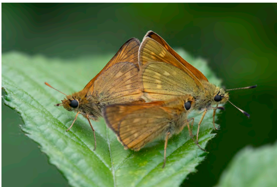
Zwartsprietdikkopjes in Het Zwarte Gat-De Slagen

Namens het bestuur van de Vlinderwerkgroep Drenthe wens ik u veel leesplezier toe en graag tot ziens op de najaarsbijeenkomst op woensdagavond 15 november in Zwiggelte!